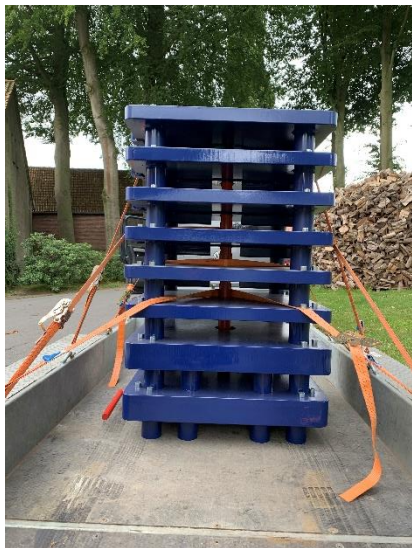
2,5 Tonnen Gewicht auf PKW-Anhänger

wahlweise per beauftragter Spedition oder auf eigene Rechnung und Risiko