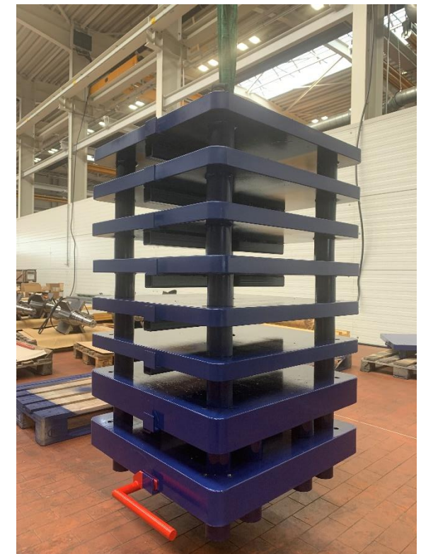
1 Block max. 2,5 Tonnen