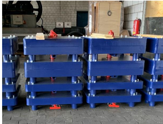
4 Block á 3 Tonnen